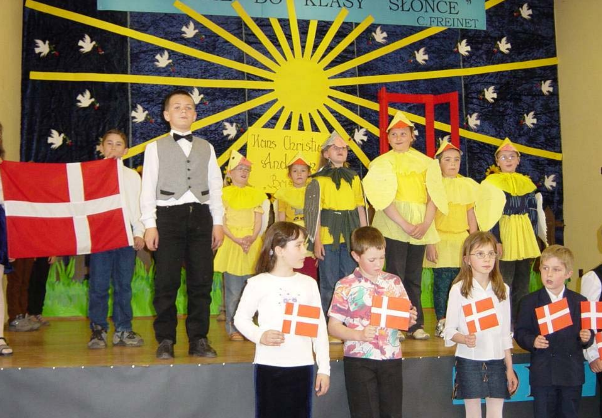
Klubbprojekt i Polen: Kr. 250.000 til skoleudstyr