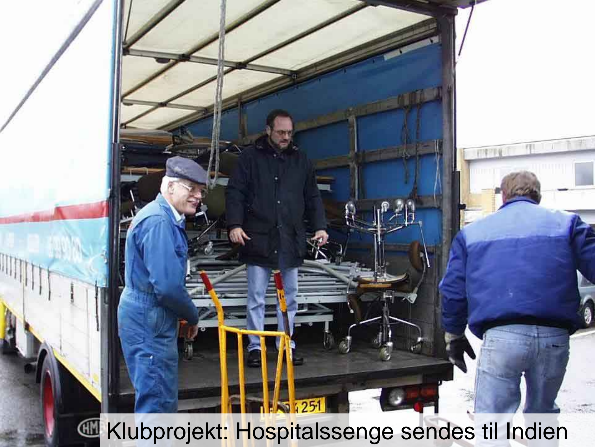
Klubprojekt: Hospitalssenge sendes til Indien